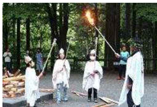
◇キャンプファイヤーが始まります

げんきプラザでの体験により5年生は今まで以上に仲良くなったと思います。げんきプラザの職員や同宿の他校の児童にしっかりと挨拶していました。また、盛りだくさんな活動を予定時間通りに仲間と協力してやり遂げていました。全体のめあてが達成できたと思います。なにより、初夏の自然の中で一つ一つの活動を仲間とともに心から楽しんでいた5年生の笑顔がきらきらと輝いていました。