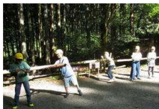
◇グループで協力してボールを運びます