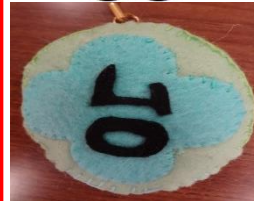
【M・Hさんが作ってくれました】