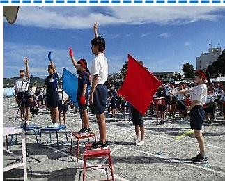
【選手宣誓 格好よかった!】