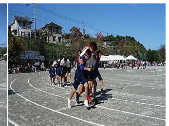
【息のあった混合増脚リレー】