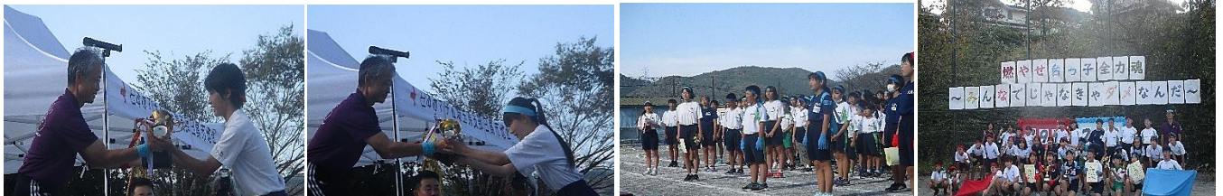
【赤組 優勝おめでとう】 【青組 準優勝 粘りました】 【閉会式 頑張りました!】 【みなさん本当によく頑張りました!】

最後に、この大運動会を成功に導くために、常に先頭に立って動いてくれた赤組と青組の団長と副団長の皆さん、そして応援団の団長と副団長の皆さん、本当にご苦労様でした。また、武蔵台小中学校として開催した初めての「大運動会」、最後まで子どもたちの活躍を見守っていただいた保護者・地域の皆様ありがとうございました。心より感謝申し上げます。