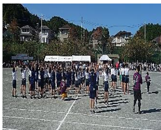
【最初はダッシュ じゃんけんぽん!】