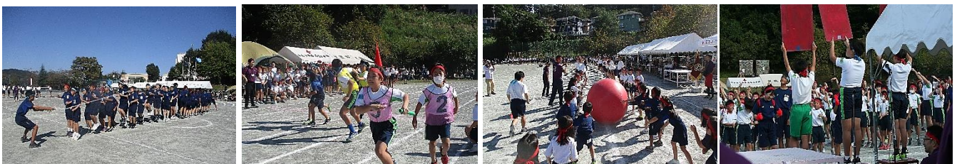
【後期課程 学年対抗大縄跳び】 【1~9年生対抗リレー 目指せゴール!】 【児童生徒会種目 大玉送り】 【点数発表 勝利はしゆに・・・】