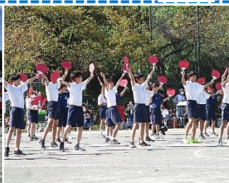
【力のこもった応援合戦 後期赤組と後期青組】