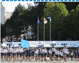
【入場行進 大運動会の始まり】