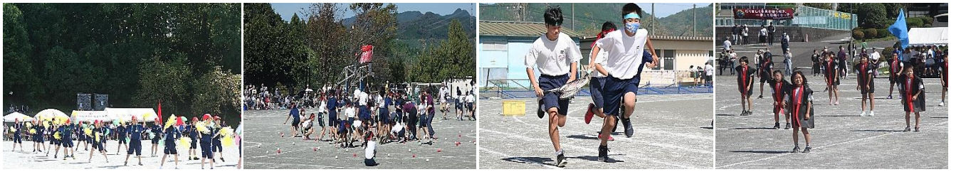
【1,2年生表現 新たなる冒険】 【5,6年生 逆転玉入れ】 【ラケット便 繋げラケット!】 【3,4年生表現 前略イタリアの道の上より】