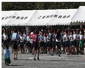
【元気いっぱいの応援合戦 前期赤組と前期青組】