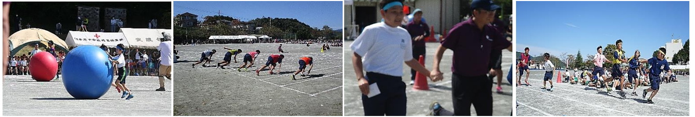
【最強の1,2年生大玉レース】 【混合リレー6人の選抜し戦士たち!】 【借り物競争 教頭先生ファイト!】 【5~9年生別対抗リレー 繋いだその光】