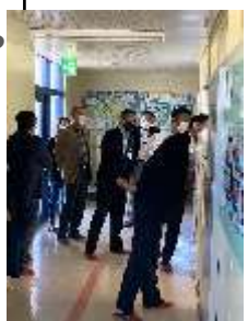
学校運営協議委員のみなさんが、廊下から授業を参観しました（高麗川小）。